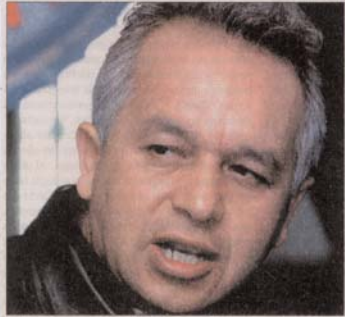
Líderes que representan más de 100 mil obreros en seis países con 15 plantas de Volkswagen, luego de un tercer encuentro anual, acordaron "desarrollar una estrategia común" para hacer frente a las empresas.