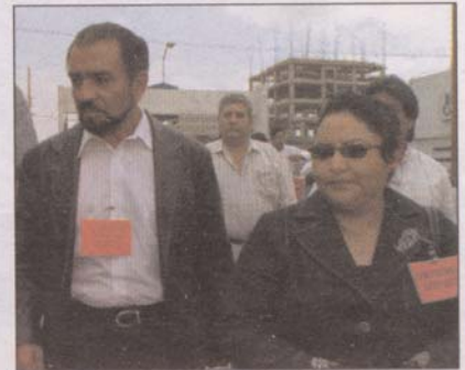
En las finanzas (18)

La "Declaración de Puebla" evidencia un cambio drástico donde lejos de que los trabajadores demanden sus derechos, ahora son las empresas las que presentan reivindicaciones.