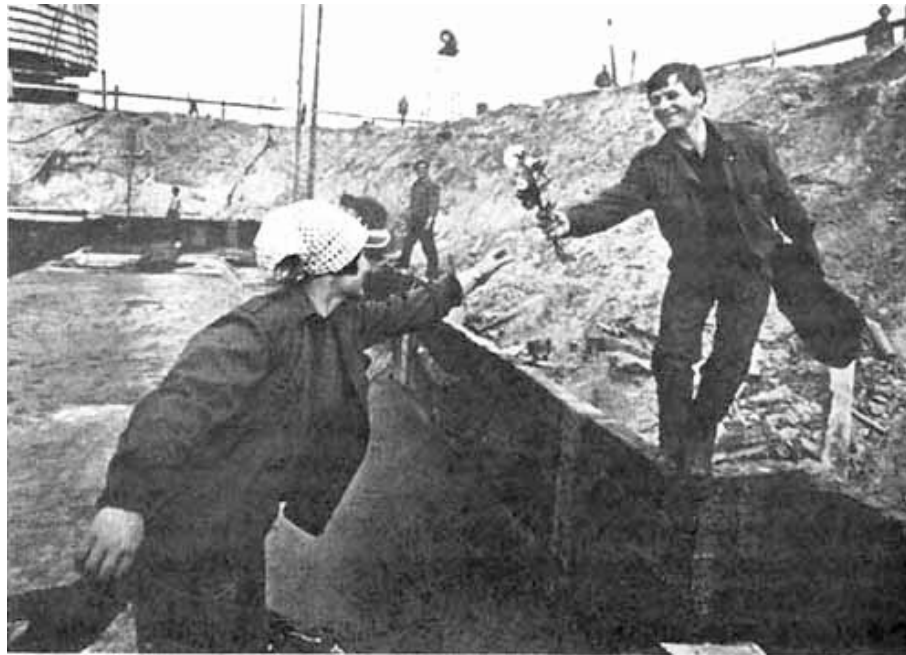
8. März auf einer Baustelle in der DDR

Nach dem 2. Weltkrieg fanden in der sowjetischen Besatzungszone bereits 1946 wieder Feiern zum Frauentag statt. In den sozialistischen Ländern, auch in der DDR, wurde die gesellschaftliche Befreiung der Frau gefeiert. Der Tag wurde mit offiziellen Feiern für die Frauen organisiert, um die sozialen Errungenschaften des Staates für die Frauen herauszustellen.