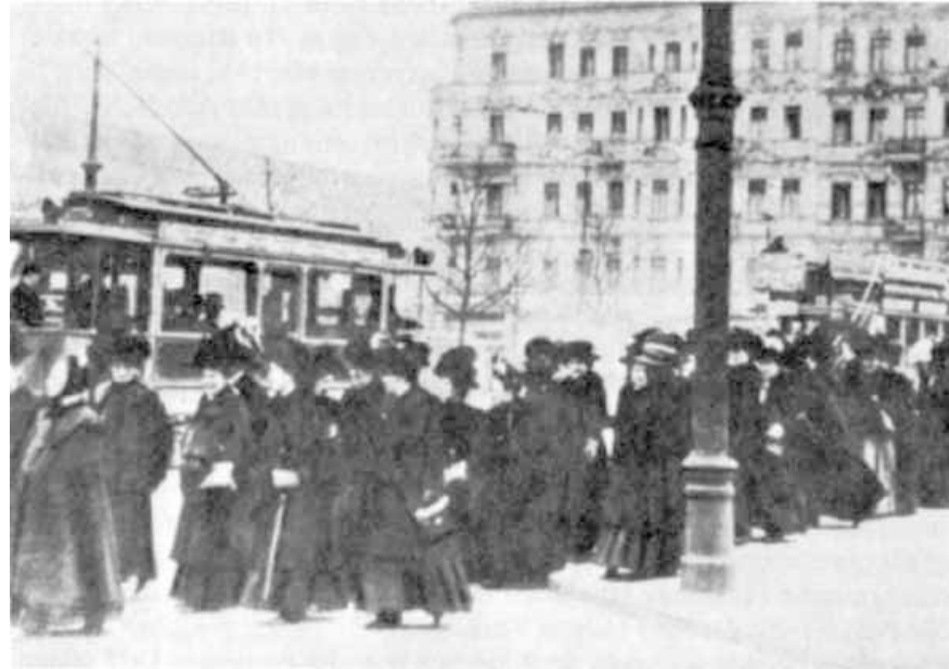
Demonstration zum Internationalen Frauentag in Berlin 1911

Aussage eines männlichen Delegierten der SPD auf dem Parteitag 1913: